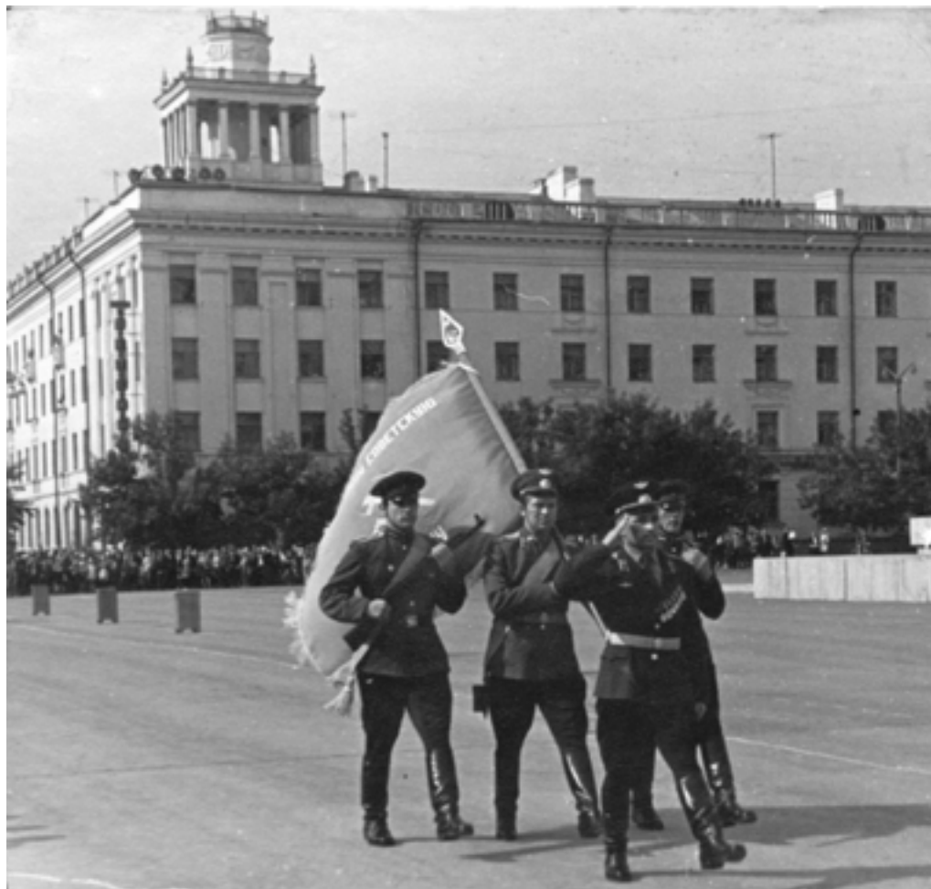
Вынос Знамени училища в день принятия присяги курсантами. 1969 год

С первых дней своего существования училище стало центром военно-патриотического воспитания населения, и, прежде всего, молодежи Курганской области. 8 ноября 1967 года жители города впервые увидели военный парад, а с 1968 года на центральной площади Кургана начало ежегодно проводиться принятие военной присяги молодыми курсантами. В этом же году на Увале был открыт