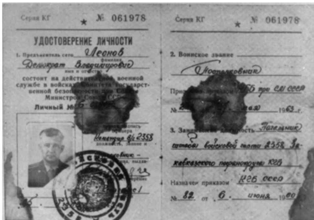
Простреленное удостоверение личности героя

История свидетельствует, что даманцы до конца выполнили воинский долг перед Отечеством, достойно продолжили славные боевые традиции русского воинства.