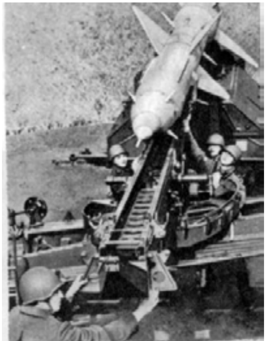
Стартовый расчет за работой

Воины противовоздушной обороны за короткий срок освоили поступившие на вооружение зенитные управляемые ракеты, позволявшие поражать средства воздушного нападения на больших дальностях, в широких диапазонах высот и скоростей полета. Легчики-истребители овладели полетами в самых сложных метеорологических условиях и метко разили цели. Воины радиотехнических подразделений отыскивали цели на предельных дально-