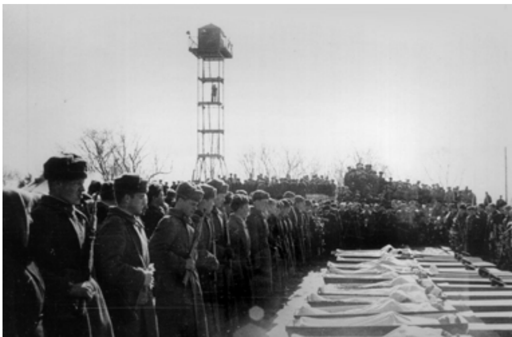
Вечная память героям – Даманцам.

нении вооруженной силы. О том, что это были не пустые слова, свидетельствуют состоявшиеся 14 и 15 марта новые попытки вторжения на территорию СССР.