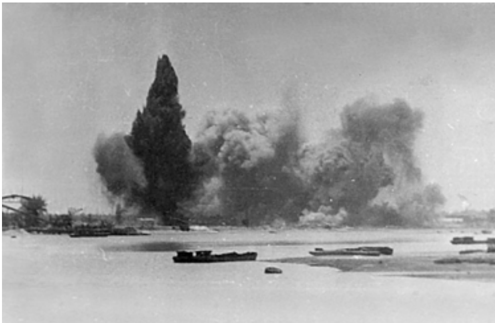
Налет американской авиации.

Иностранные корабли бомбардировкам, как правило, не подвергались, но угроза жизни была реальной. Так, во время одного из налетов, бомба попала в польское судно “Йозеф Конрад” – 4 человека были убиты и 19 ранено. Эки-