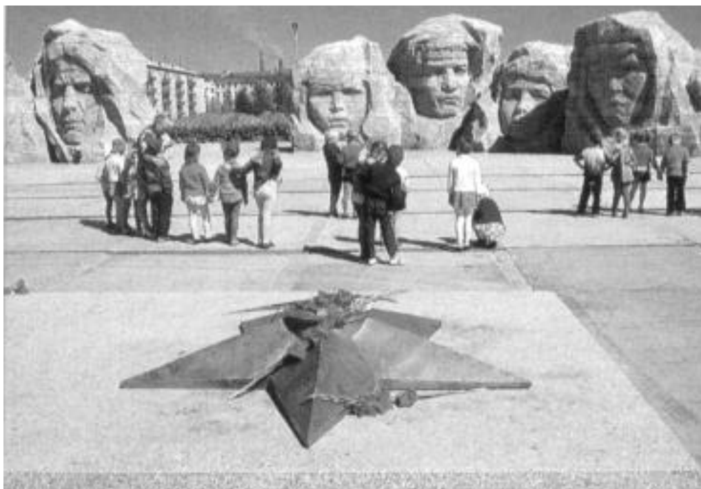
У мемориала памяти пограничникам-дальневосточникам

сговор с империалистами и встал на путь “реставрации капитализма”.