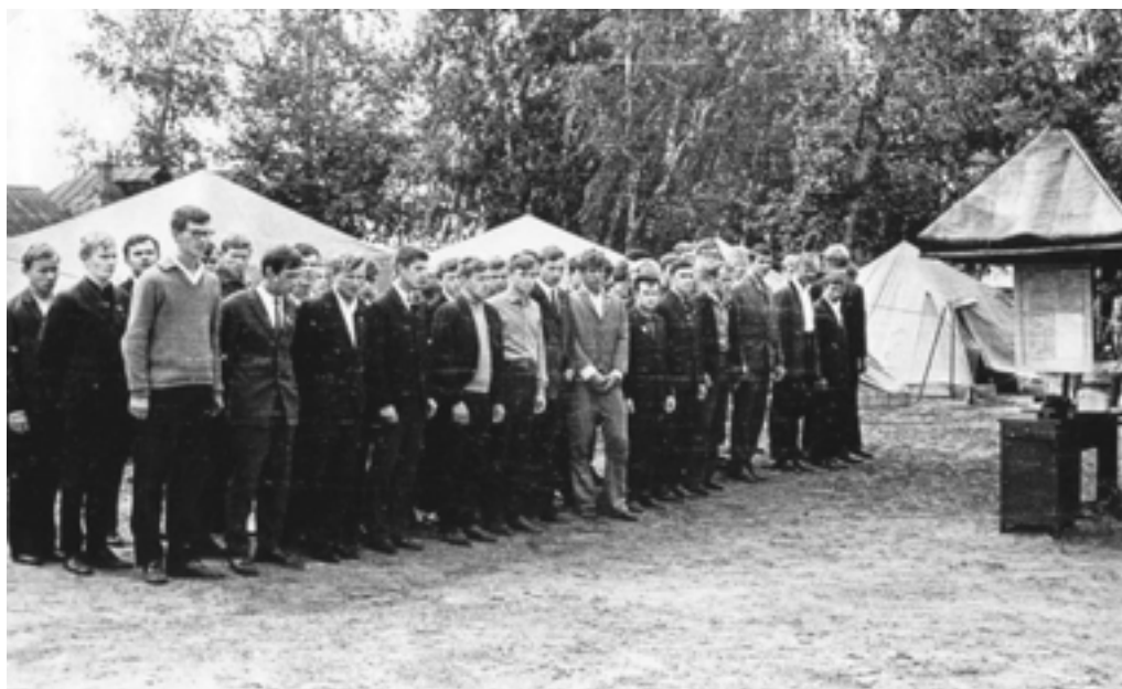
Абитуриенты в палаточном лагере на Увале