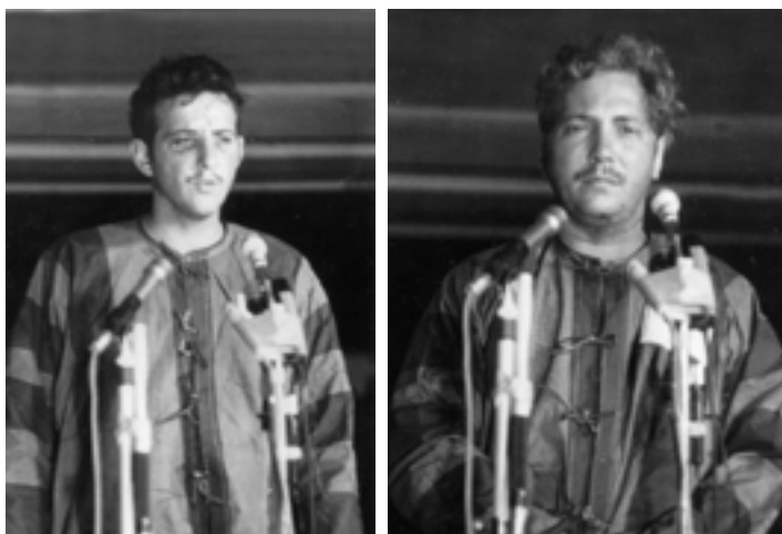
Пленные американские летчики на конференции в Ханое.

паж “Мичурина” участвовал в тушении пожара и оказывал помощь пострадавшим. Налетам американской авиации противостояли зенитно-артиллерийские подразделения Вьетнама. Всестороннюю помощь им оказывали советские военные специалисты, одетые в гражданские костюмы.