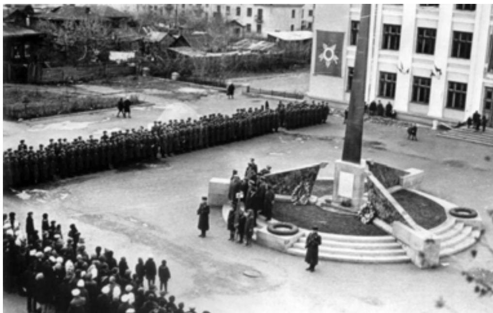
Мемориал Победы в Кургане

Достижению хороших результатов в службе и работе военных комиссариатов во многом способствовало обновление учебно-материальной базы, появление новых более совершенных технических средств обучения. Совершенствовались государственные средства связи (телеграф, междугородняя связь, радио), внедрялись технические средства оповещения и управления мобилизацией. Устанавливались автономные радиоузлы и системы оповещения “Сигнал”. Организовывалась круглосуточная работа дежурных сил, разрабатывались планы оповещения в выходные и праздничные дни, для чего задействовались вертолеты, автомашины с громкоговорящими установками, использовались возможности медицинских учреждений, таксомоторных парков и автохозяйств, отрабатывалось взаимодействие с органами гражданской обороны. (Архив облвоенкомата, приказы 1962-68 гг.).