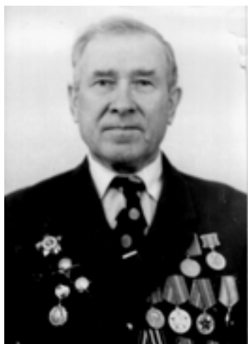
Замятин Семен Павлович