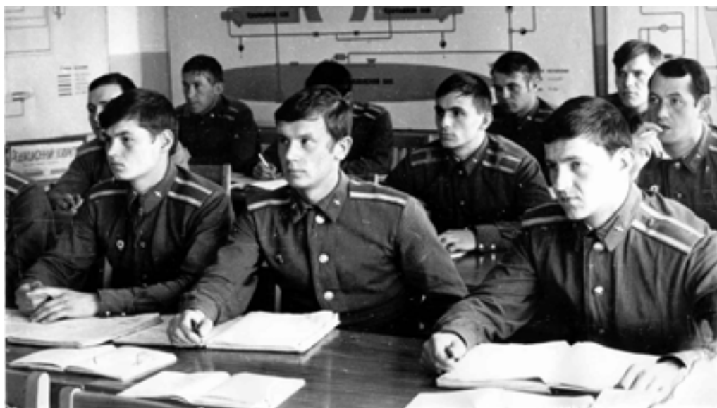
Встреча с ветеранами в одной из аудиторий

– Вы, собственно, в этих местах преемники наши, – волнуясь, говорили курсантам фронтовики – Верим, не посрамите воинской чести старшего поколения!