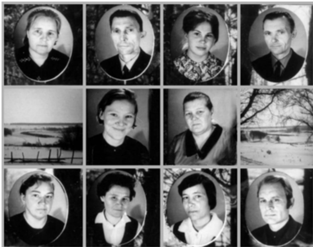
Коллектив учителей Зырянской восьмилетней школы. 1968 год.

Мы уверены в том, что охрана наших границ в надежных руках. Все ребята нашей школы хотят служить только на границе. Они обязались быть