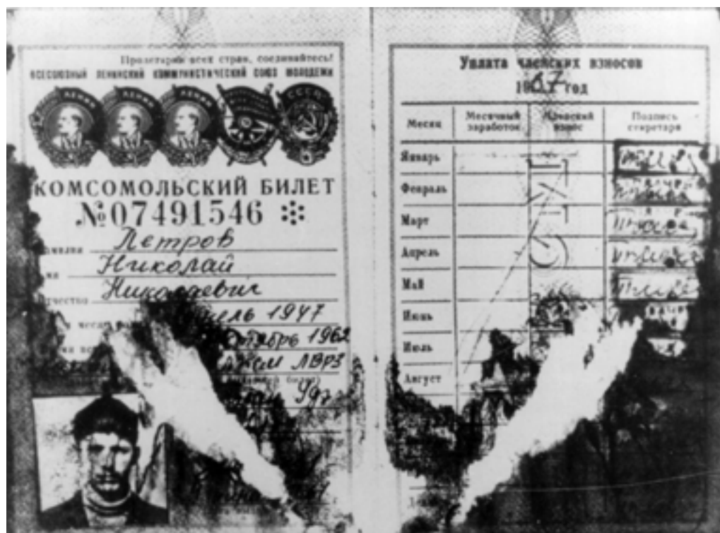
Простреленный комсомольский билет погибшего пограничника.

целине, поступать учиться в институты и университеты.