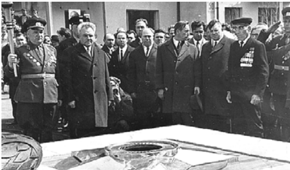
Торжественный момент – 9 мая 1970 года.