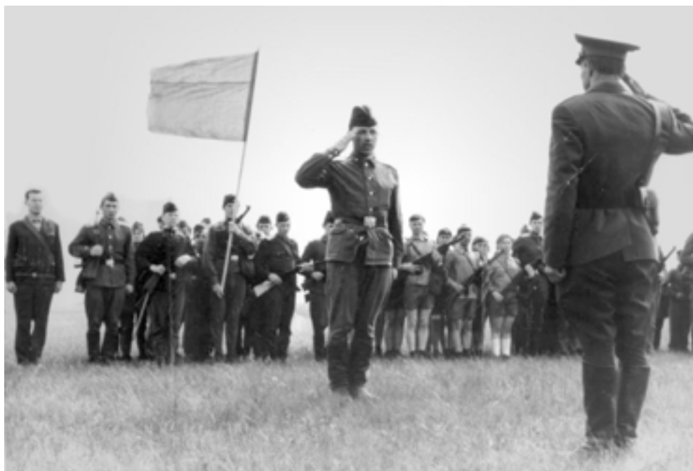
«Зарница» 1969 год

монумент “Слава Советской Авиации” в виде самолета МиГ-15 на постаменте.