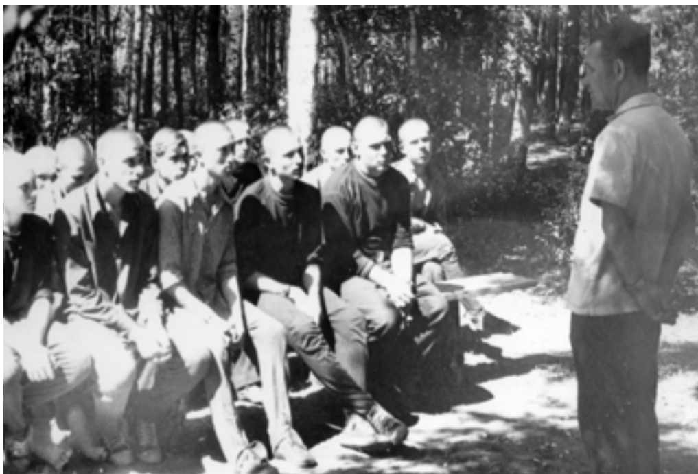
На учебном пункте в Половинском районе