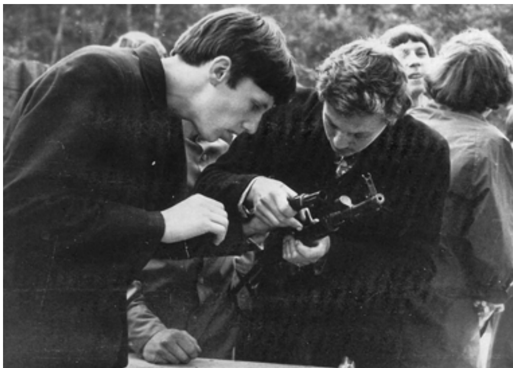
Изучение оружия в военно-спортивном лагере

рядка дня), улучшали свою физическую подготовку, посещали различные мероприятия.